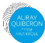
Auray Quiberon Terre Atlantique