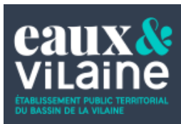
Eaux et Vilaine